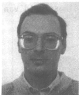
22. POL DE CORTE